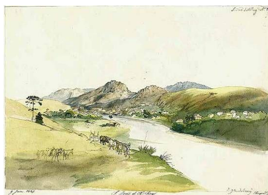
Figura 1: Pintura de Johann Moritz Rugendas. 1824. Esta pintura apresenta a relação entre a Serra do Lenheiro e o Córrego do Lenheiro, que na época chamava-se Córrego do Tijucu.

Rugendas destaca a imponência da Serra em relação à cidade, assim como o Córrego do Lenheiro, que naquela época chamava-se Córrego do Tijucu, em seus relatos o artista destaca a "rica vegetação que cerca as residências dispersas pela encosta das montanhas e pelos vales vizinhos" (CUNHA, 2007). Como é retratado na figura 1 abaixo.