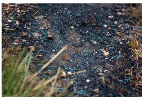
Figura 5: restos de queimada de fios para retirada de cobre. 2017.