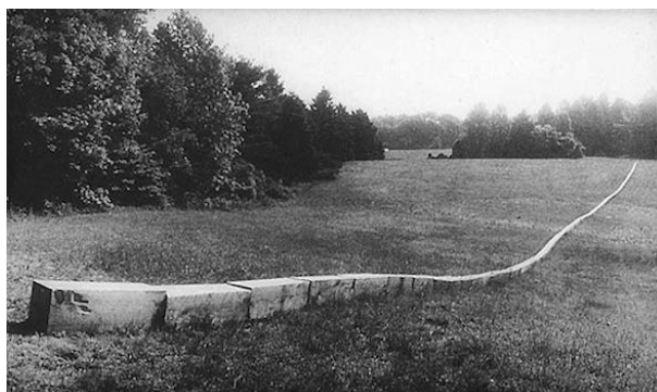
Figura 10: Carl Andre. Secant. 1977.

Comparo, portanto, uma das obras de Carl Andre com os muros de pedras construídos por escravos na Serra, apresentados na Figura 11, e que muito se assemelham em aspectos artísticos.