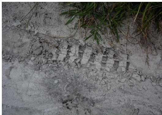
Figura 6: Marcas de pneus de motos de trilha. 2017