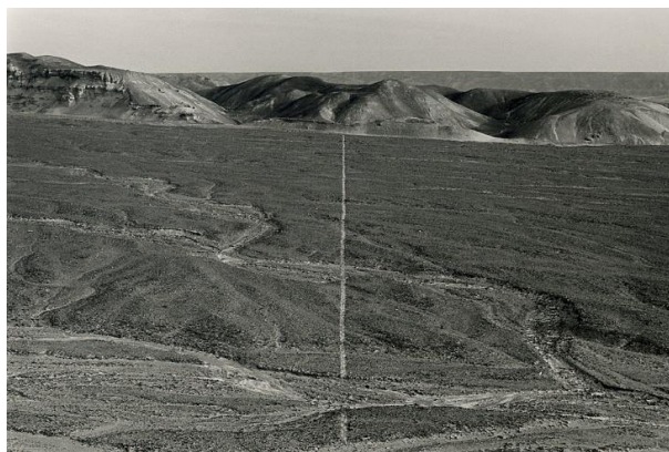
Figura 8: Trabalho de Richard Long. WALKING A LINE IN PERU. 1972, mostra uma linha na paisagem formada por repetidas caminhadas pelo mesmo local.

No livro são apresentadas diversas obras de arte na categoria Land Art, que se utilizam ou modificam a própria natureza para criações artísticas. Um dos trabalhos exemplificados em Overlay é do artista Richard Long, que por repetidas caminhadas no mesmo ponto/direção formou-se uma linha na paisagem, apresentado na Figura 8. Esta obra intencional pode ser comparada com uma imagem realizada utilizando um drone, apresentada na Figura 9, em que é possível ver a degradação formada por trilheiros de moto, na Serra do Lenheiro, que por inúmeras repetições de passagem em um mesmo trecho, deixou marcas na paisagem do local.