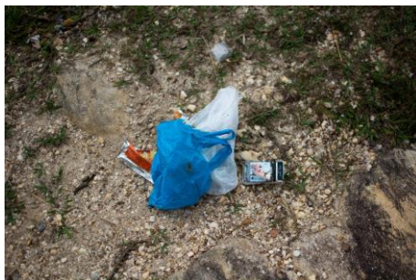
Figura 4: Resquícios de visitantes do “olho d’água”. 2017.