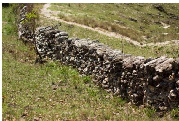
Figura 11: Muro de Pedra, na Serra do Lenheiro. 2016.