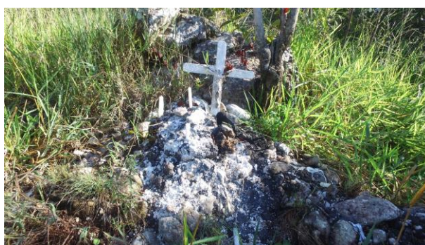
Figura 7: uma das estações da Via Sacra, que é realizada todos os anos durante a Semana Santa e o período que a antecede. 2017

Após a última estação da Via Sacra, seguimos a caminhada e chegamos ao ponto inicial da caminhada realizada na terceira visita à Serra, em seguida pegamos um atalho, que nos levou de volta à Igreja de São José.